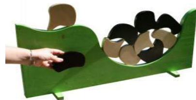
Montagne à vaches